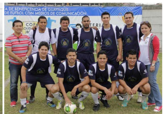
El equipo de Diario Expreso tuvo una destacada participación en la Copa.