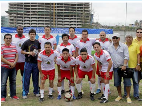
Cable Visión se hizo acreedor al Vice campeonato, después de un emocionante partido con el equipo de la JBG