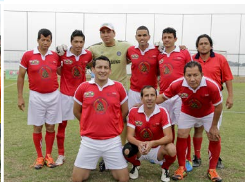
Radio sucre obtuvo el tercer lugar después de ganar a Diario Expreso.