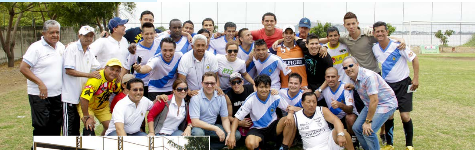
El equipo triunfador JBG con sus integrantes, directivos, cuerpo técnico y funcionarios.