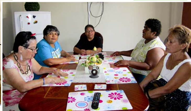
Hogar protegido de mujeres

En el proceso de reinserción familiar, social y laboral que viene desarrollando el Instituto de Neurociencias, ubica a la familia del paciente como centro fundamental de esta labor. El respeto, la comprensión y el amor son las herramientas fundamentales que deben tener para entender que el paciente de la salud mental pasa por problemas de ansiedad, depresión, incluso estados psicóticos.